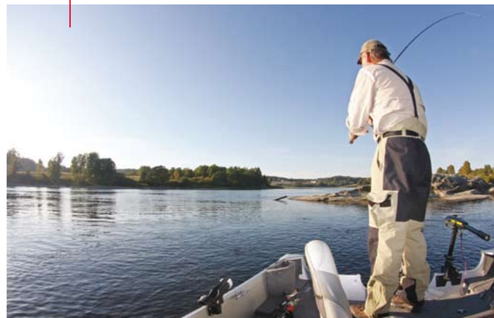
Werpen leverde het meeste en de grootste vis op.

vorige dag en wederom vangen we een paar dikke vissen. Het blijkt ook de rest van de week een superstek te zijn.