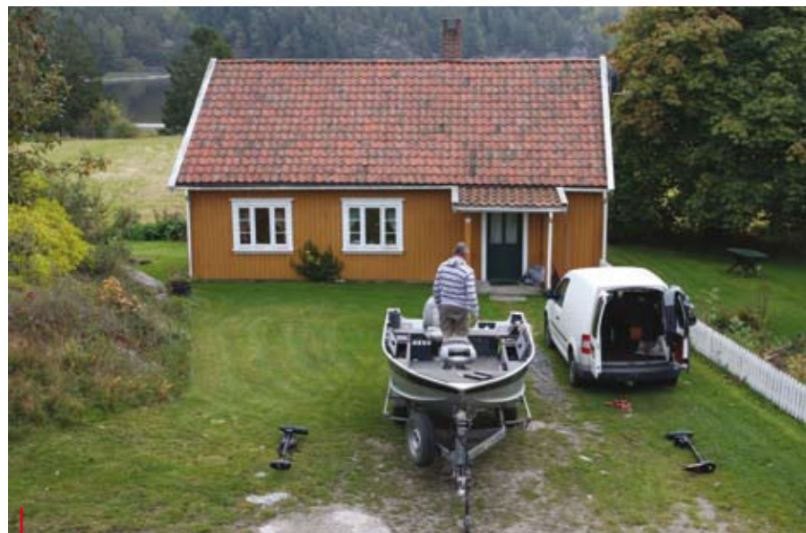
Een comfortabel huisje direct aan het water.

van zo'n 70 centimeter. Een beter begin van je trip kun je niet hebben. Een paar honderd meter verder besluit Bram een topwater lure aan zijn speld