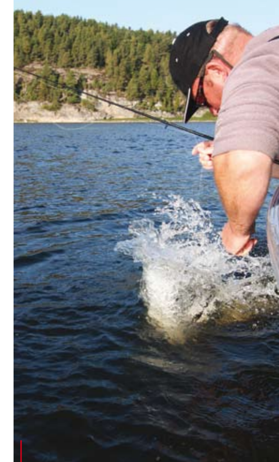
De Noorse snoeken blijken echte vechtersbazen te zijn.

's Avonds is er overleg in het huisje en we besluiten voor de komende dagen verder stroomopwaarts te gaan in de richting van Furuholmen, een dorpje van een paar huizen. Hier splitst de Glomma zich. Rechtdoor is het water heel breed en er staat betrekkelijk weinig water, gemiddeld een metertje of drie, maar er loopt wel een soort geul doorheen met een diepte van een meter of vijf. Linksaf vinden we een doodlopend stuk van ongeveer tien kilometer lang, waarvan de eerste paar kilometer niet veel meer is dan een heel ondiepe plaat met hier en daar dode bomen onder water. Hier zullen we dus alleen maar stapvoets overheen kunnen varen met Bram op de punt voor het geven van aanwijzingen. In dit gedeelte van de Glomma moet ook goed snoekbaars zitten. We proberen het maar eens. De bomen zijn op dit stuk een probleem. Niet dat we er honderden tegenkomen, maar als je over twee meter water vaart en die boom zit dertig centimeter onder water, dan kun je echt niet hard varen. Eenmaal in het diepere water aangekomen, is het weer zoeken naar vis. Veel planten staan hier niet en het is vaak diep tot in de kant. We hadden van een paar Nederlanders, die hier een keer gevist hadden, gehoord dat zij snoek vingen boven zeer diep water in de buurt van scholen prooivis. Ook wij komen scholen kleine vis tegen met daarom heen grote vissen, hetgeen goed te zien is op de dieptemeter. Het water