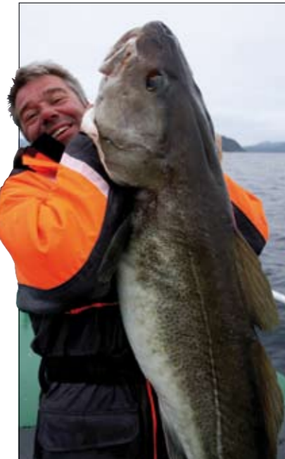
Je moet hier niet op een onsje meer of minder durven kijken...