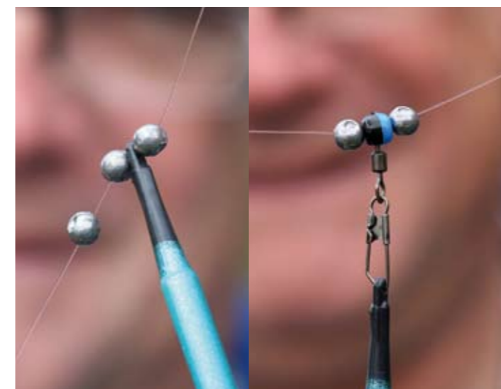
Monteer je matchpen direct op de hoofdlijn zoals links, of via een float-connector (zie rechterfoto). Overigens vertegenwoordigen deze loodhagels twee derde van het totale loodgewicht en zijn daarom dus direct rond de dobber geplaatst.

machvisser immers af op wat de winkelier vertelde, terwijl die zich op zijn beurt weer beriep op de (waarschijnlijk Chinese) gebruiksaanwijzing bij de afhouder. Ook de dobber zelf laat duidelijk te wensen over. Een dik en slechts 15 centimeter lang matchpen-tje werpt namelijk minder