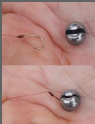
Als peilloodje volstaat een zachte AA-loodhagel, die je voorzichtig op de haak knijpt.

Matchpennen/wagglers: 30 -35 cm lang, voor diverse loodgevichten • Zakje float-connectors • Verdeeldoosje met loodhagels