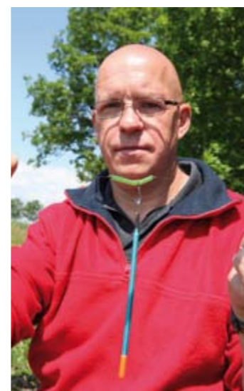
Het gebruik van zulke hoekafhouders om de matchpen mee op de lijn te zetten, raadt Ed ten zeerste af.

machvisser immers af op wat de winkelier vertelde, terwijl die zich op zijn beurt weer beriep op de (waarschijnlijk Chinese) gebruiksaanwijzing bij de afhouder. Ook de dobber zelf laat duidelijk te wensen over. Een dik en slechts 15 centimeter lang matchpen-tje werpt namelijk minder