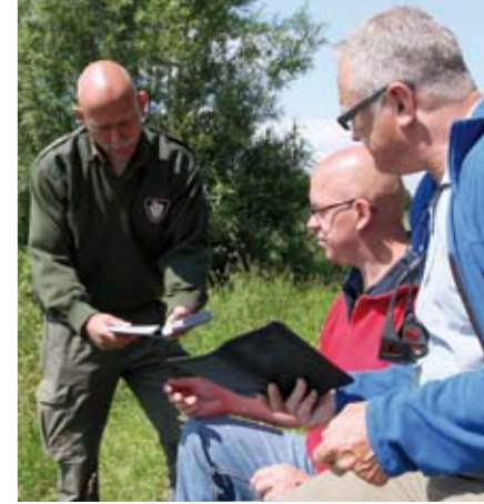
Controle! Maar niks aan de hand, de mannen hebben vanzelfsprekend de juiste VISpas en lijst van viswateren bij zich!

op de containers namelijk niet alleen de naam, maar vaak ook het gewicht vermeld. Zo is de grootste maat (SSG) 1,89 gram zwaar, AAA 0,81 gram, BB 0,40 gram en de nummers 1, 2, 3 en 4 respectievelijk 0,28; 0,24; 0,20 en 0,17 gram. Een piepklein loodje als verklikkerloodje onderaan – bijvoorbeeld een nummertje 10 van 0,034 gram – beïnvloedt de stand van de waggler nauwelijks en telt evenmin mee voor de verdeling van twee derde – een derde. Die een derde betreft meestal twee tot hooguit drie loodhagels, waarvan de kleinste altijd onderaan hangt (het dichtst bij de haak) en de