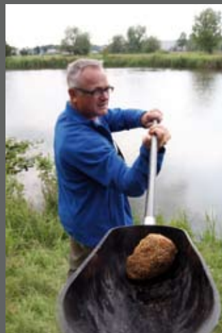
Met een voerschep werp je de voerballetjes stukken verder en preciezer in vergelijking met een worp met de hand.

Omdat je met de matchhengel meestal verder uit de kant vist dan met de vaste stok, dient er ook op afstand gevoerd te worden. Dat vraagt behalve goed plakkend lokvoer ook de nodige ervaring en oefening. Maar al snel zal een beetje matchvisser zijn voerballetjes gemakkelijk over een twintigtal meters keurig met de hand bij de dobber weten te gooien. De voerkatapult is nog altijd verboden, maar met een werpschep kom je ook een eind in de goede richting. Ga met zo'n schep eerst eens oefenen op een grasveld waar je niemand tot last bent. Neem een stel aardappels van het formaat voerbal en een emmer mee en ga net zo lang gooien tot alle piepers in dan wel vlakbij de emmer terechtkomen. 's Avonds kun je aardappelpuree eten!