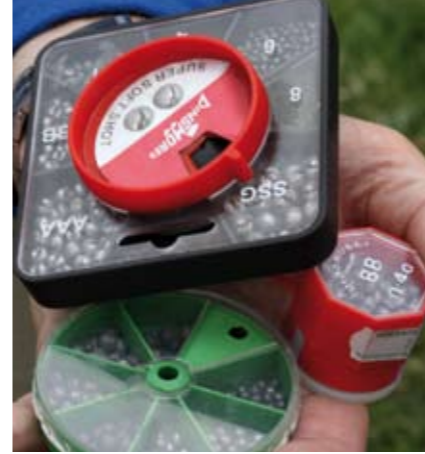
Een bakje gecodeerde loodhagels zorgt dat het gemakkelijk rekenen is.